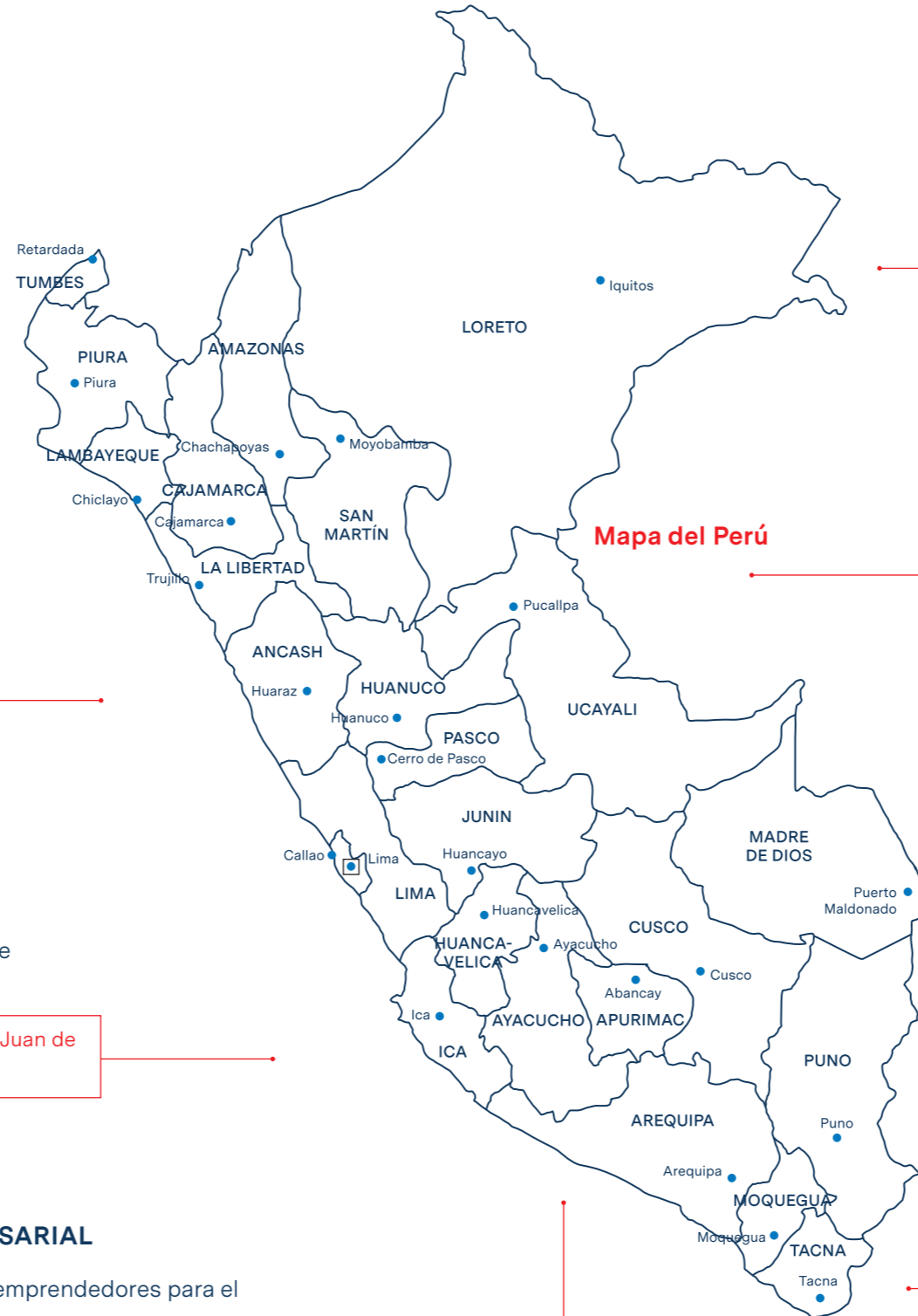
Mapa del Perú