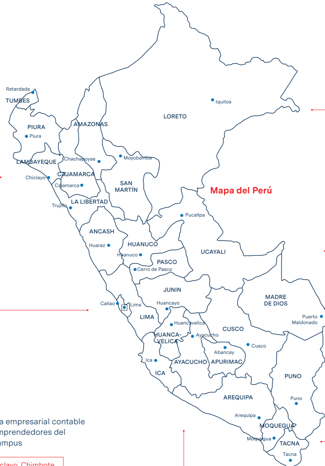
Mapa del Perú

Lugar: Ate, Callao, Chiclayo, Los Olivos, Piura, San Juan de Lurigancho y Trujillo